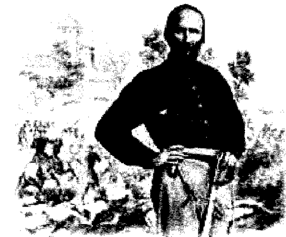
In alto, la manifestazione del Movimento dei Forconi a Palermo di mercoledì 25 gennaio, giorno dell'incontro Monti-Lombardo. A fianco, Giuseppe Garibaldi in una stampa di fine Ottocento. Sotto il presidente del Consiglio, Mario Monti